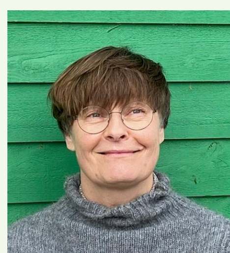
Lone Blak Lund Fysioterapeutuddannelsen, VIA University College

NÆSTE KURSUS afvikles d. 19. SEPTEMBER og 9. OKTOBER i HERNING. Se https://human-first.org/ eller scan QR-koden. Tilmelding igennem Plan2Learn åbnes ultimo april 2024. Kurset henvender sig til alle indenfor social- og sundhedsområdet der arbejder med rehabilitering i Region Midt.